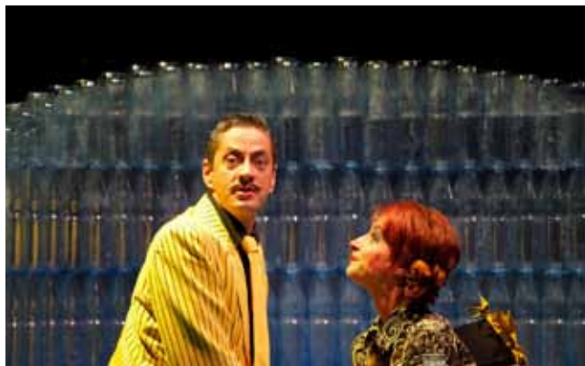
Mit Golo und Frieda ins softdrinkfreie Dresden ?