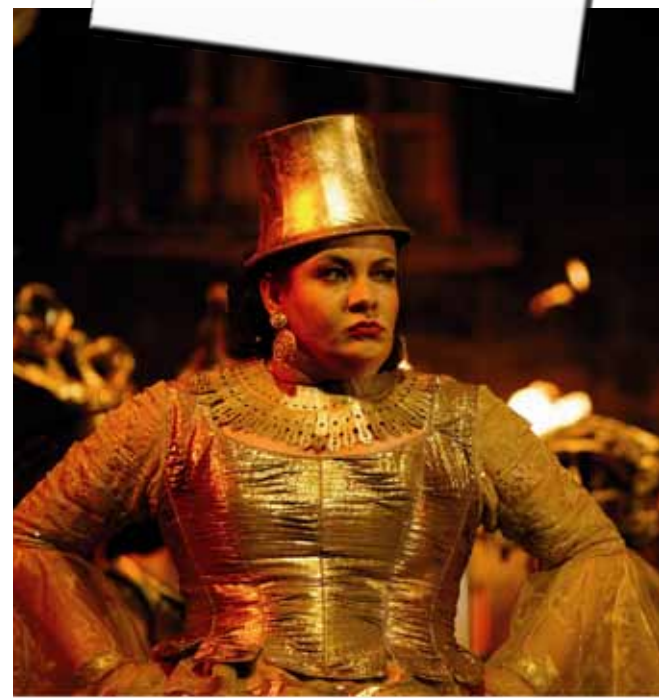
Zur Straßensängerin Périchole nach Peru?