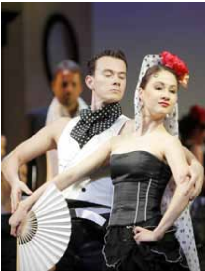
Mit Carmen ins heiße Spanien ?

Auf dem Spielplan 2010/11 stehen 13 Repertoire-Stücke und vier Premieren – Wohin soll's denn gehen?