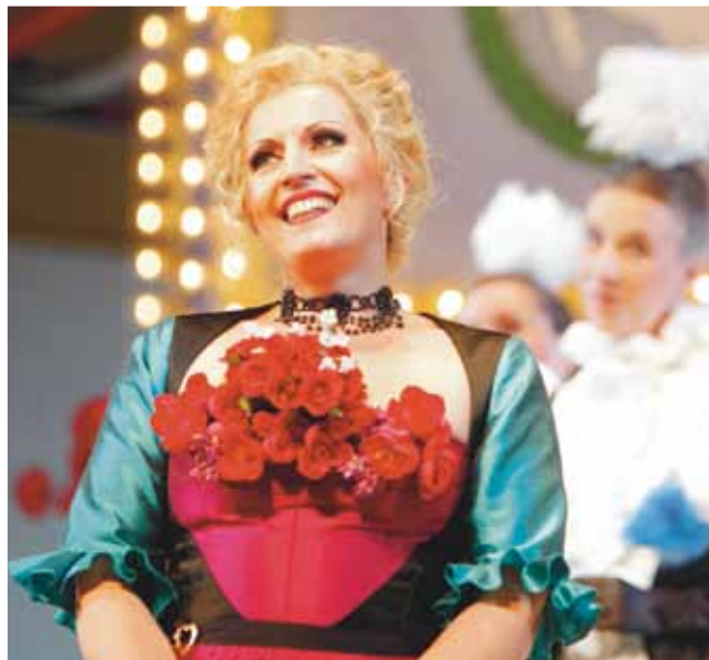
Zum Lustigsein ins Salzkammergut?