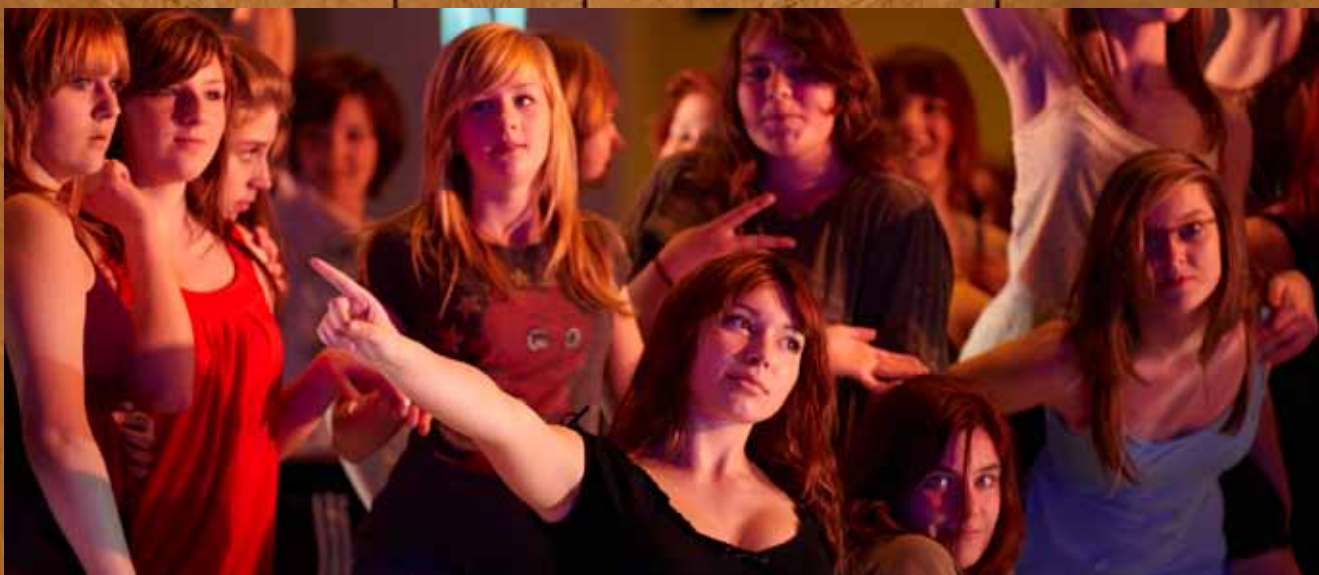
* Schülerinnen des Gymnasiums Dresden-Plauen und der 64. Mittelschule

PARDON! DAS JUGENDTANZPROJEKT DER STAATSOOPERETTE DRESDEN