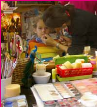
Katze, Fee oder Clown? Die Kolleginnen in der Maske erfüllen Kinderträume.

Kurzweilige musikalische Programme bieten Sänger des Hauses, der Kinderchor, das Streichquartett und das Blasorchester und runden somit diesen abwechslungsreichen und unterhaltenden Vormittag in der Staatsoperette Dresden ab.