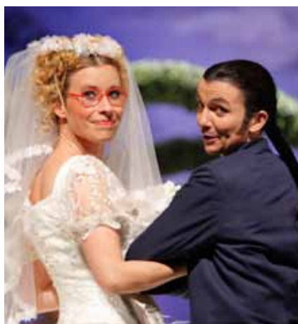
Zu Prinz Methusalems Hochzeit in Rikarak?