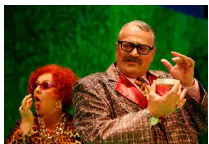
Onkel und Tante in Dingsda besuchen?