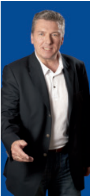
*Intendant Wolfgang Schaller

Sehr verehrtes Publikum, liebe Freunde der Staatsoperette Dresden,